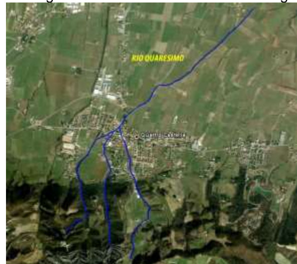
Uno dei rii LIFE RII: i tre rami sottopassano l’abitato

Il reticolo minuto che raccoglie le acque in ambito montano, spesso costituito da piccoli rii di 1-2 m di larghezza dal carattere torrentizio, è infatti caratterizzato da forti pendenze e dalla quasi totale assenza di aree per l’espansione delle piene, come conseguenza della sua naturale morfologia.